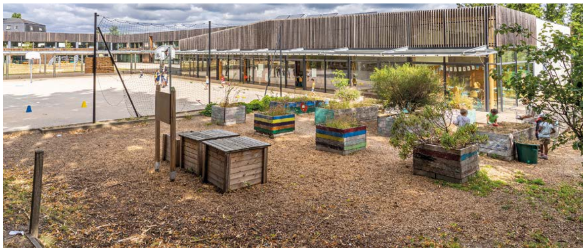
Le Pôle d’excellence éducative, à proximité du centre-ville, se veut être un élément fédérateur.