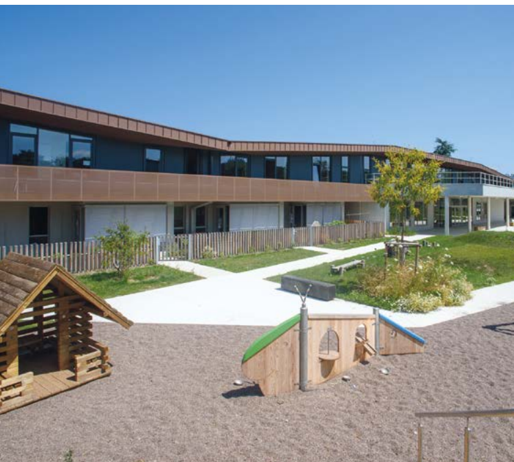
Les infrastructures se mettent au service de la concrétisation du parcours de chaque jeune.