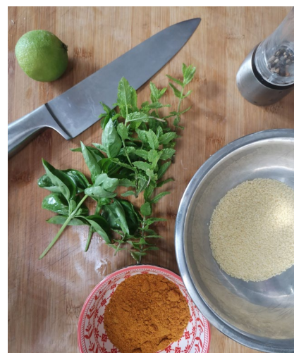
La restauration à domicile est l'une des expressions de l'économie informelle.

Parfois perçue comme une nuisance, l'économie informelle est dorénavant un sujet d'études, car elle vient non seulement expliquer certains mécanismes qui ne sont pas visibles par les institutions, mais elle pourrait également être porteuse de