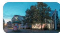
Bâtiment SH2 avenue Jean Perrin