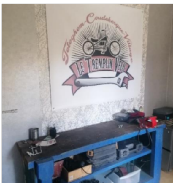
Local Tremplin vélo

Un atelier vélo porté par un centre social, animé par des jeunes bénévoles du quartier en pied d'immeuble : l'expérience concilie les mobilités durables, l'économie circulaire, le lien social et la gestion urbaine de proximité. Une initiative favorable dans un contexte de renouvellement urbain qui va transformer le quartier sur les prochaines années.