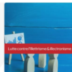
L'illettrisme dans les quartiers prioritaires de la ville : comprendre pour agir en Hauts-de-France Mercredi 3 mai 2023, Creative Mine WALLERS-REMBERG