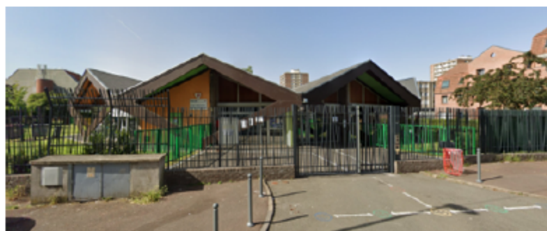
Ecole Maternelle Rachel L'Empereur, quartier Sud de Lille.