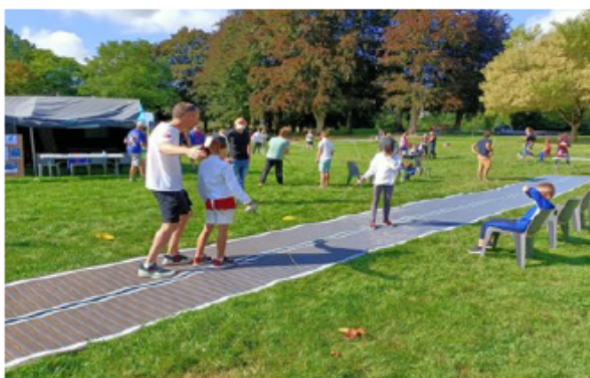
Fête des sports, Arras

C'est dans ce contexte que la Cité éducative a relancé le dispositif « L'école des sports ». Dispositif amorcé dans le cadre de la réforme des rythmes scolaires en 2013, puis arrêté. Fortement axée initialement sur la performance sportive, l'école des sports a aujourd'hui glissé vers un axe éducatif avec une forte valeur inclusive visant l'épanouissement des enfants et des jeunes par le développement de pratiques sportives et d'activités de bien-être corporel.