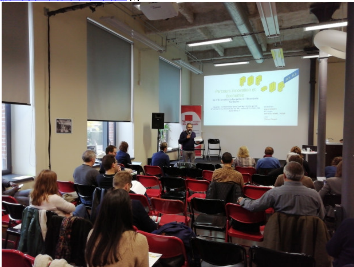
Parcours économie et innovation - Benchmark de l'ADULM

Dossier thématique de l'ADULM : Démarche "Développement économique et emploi pour les quartiers en renouvellement urbain" [8]