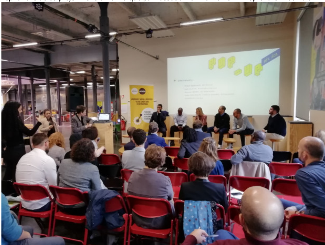
Plateau radio sur l'Emergence

Visionnez le webdoc de l'IREV " L'esprit d'entreprendre [10]" pour comprendre les origines et inspirations de ce projet mené à Dunkerque par l'association Horizon et Entreprendre Ensemble