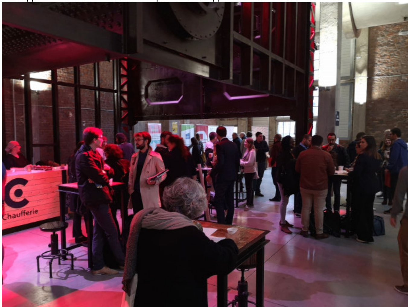
La chaufferie - accueil du matin

Le lieu investi, la Plaine Images est, sur la métropole, le site d'excellence dédié aux industries créatives. Implantée à cheval sur Tourcoing et Roubaix, dans un quartier prioritaire et sur le site d'une ancienne usine textile, la Plaine Images est actuellement un écosystème reconnu internationalement, ouvert sur le monde et mêlant des entreprises, des commerces, des écoles au service de la filière des industries créatives. C'est donc dans ce lieu emblématique et inspirant que le Pop-Up a déployé ses 6 grands parcours (voir ci-dessous) pour aborder les articulations entre développement des activités économiques et développement social et urbain.