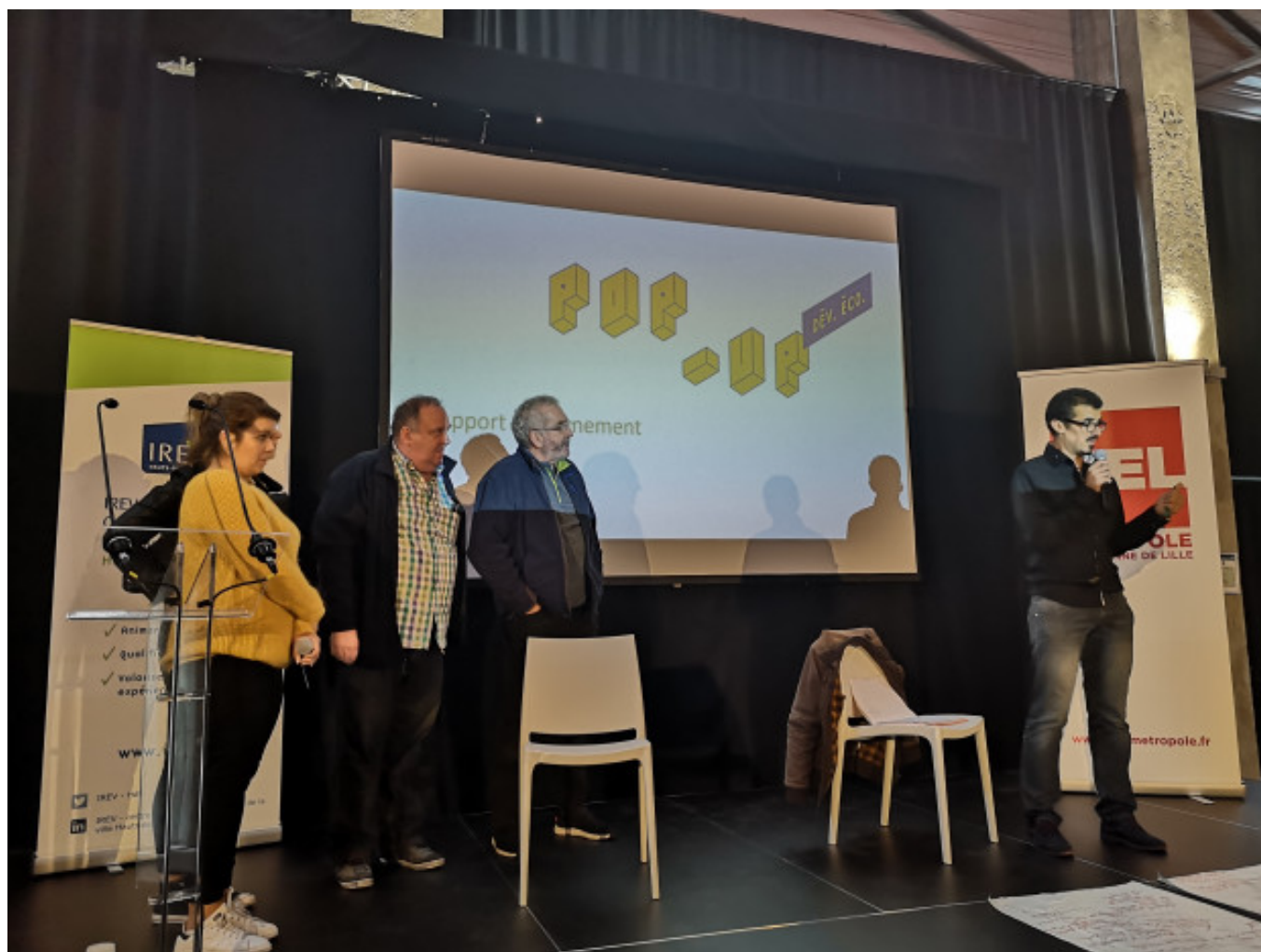
Synthèse du parcours attractivité par les conseils citoyens