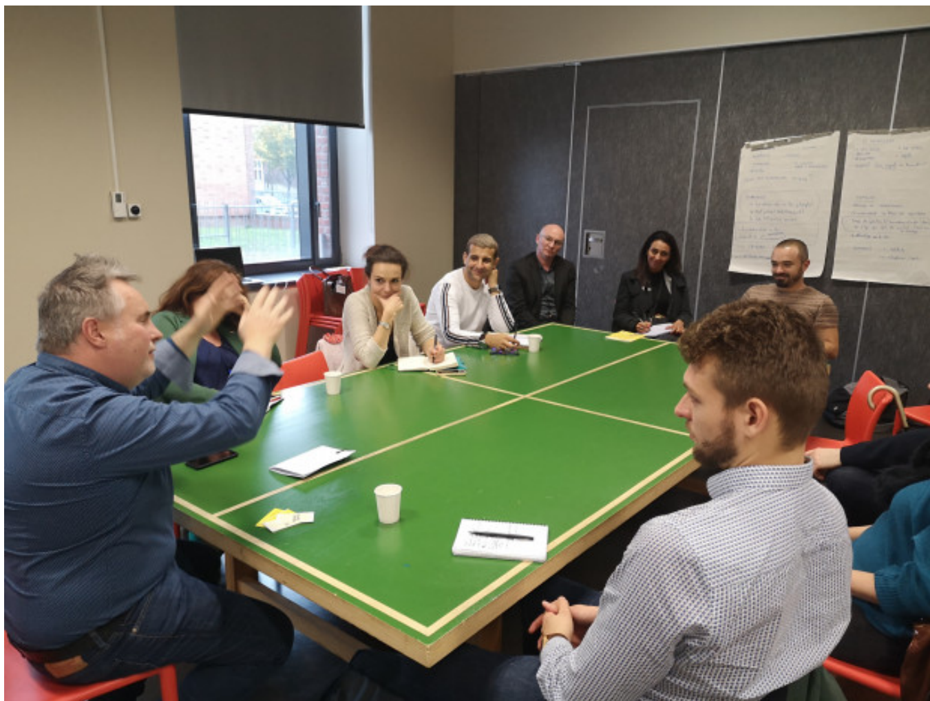
La Plaine Images par son directeur

Remerciements aux nombreux partenaires qui se sont mobilisés toute la semaine MEL toi du territoire, des acteurs nationaux, régionaux et locaux nous ayant permis de mettre en résonance des actions et expérimentations portées par différents territoires : Etat, Région, URH Hauts-de-France, BPI France, Amiens Métropole, l'Agglomération Creil Sud Oise, Valenciennes Métropole, Les acteurs du Dunkerquois, la Chambre des métiers et de l'artisanat Hauts-de-France, Face MEL, ADULM, Réseau Alliances, pôle emploi, Missions locales de la métropole entre autres et évidemment la MEL qui a accueilli une semaine de débat pour faire vivre le développement économique dans ses quartiers.