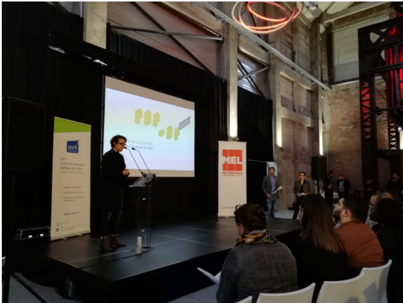
Discours de Milouda ALA