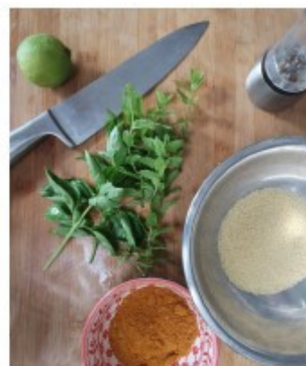
La restauration à domicile est l'une des expressions de l'économie informelle.

Parfois perçue comme une nuisance, l'économie informelle est dorénavant un sujet d'études, car elle vient non seulement expliquer certains mécanismes qui ne sont pas visibles par les institutions, mais elle pourrait également être porteuse de