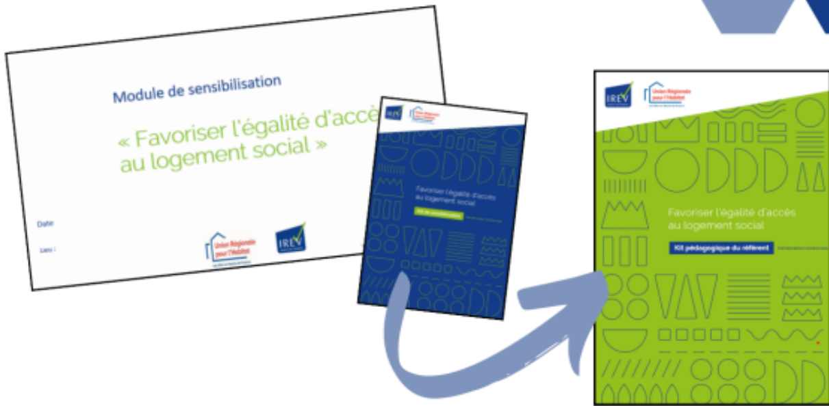
Supports de formation - Sensibilisation "Favoriser l'accès au logement social"