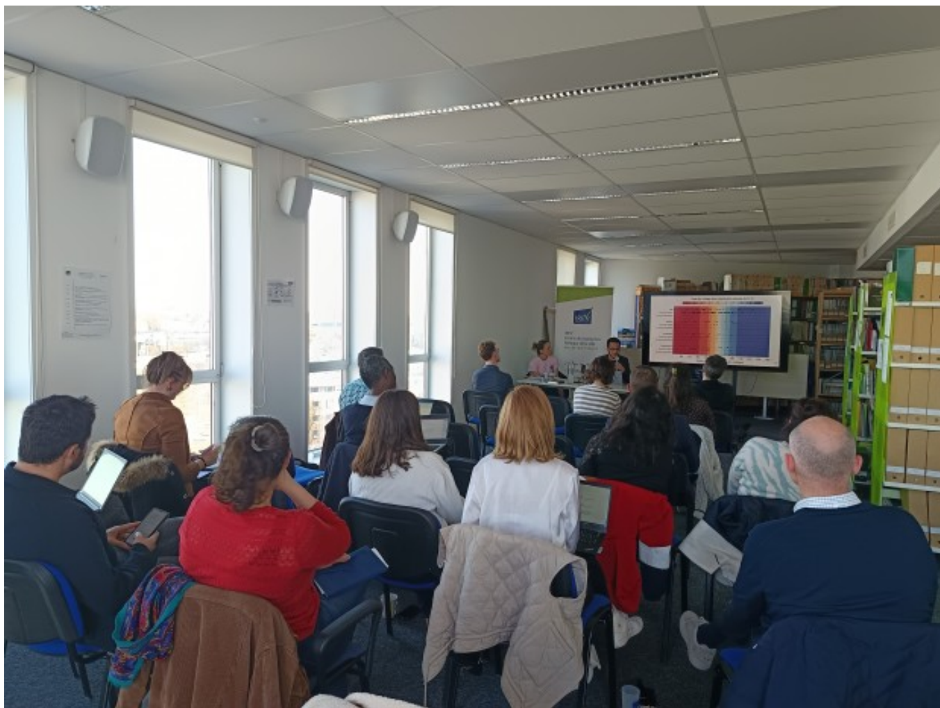
Centre de documentation de l'IREV