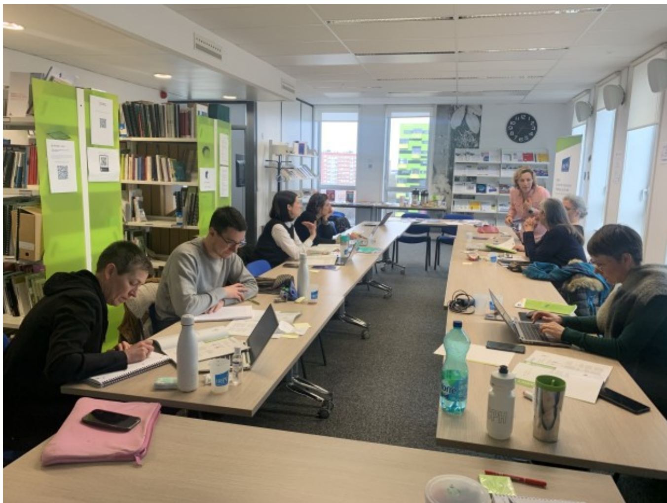
Session nationale dédiée aux CRPV

Après une expérimentation régionale riche en enseignements, ce travail, construit avec des bailleurs, collectivités et des représentants de locataires, s'étend désormais pour répondre aux enjeux d'égalité et de non-discrimination dans l'ensemble des territoires.