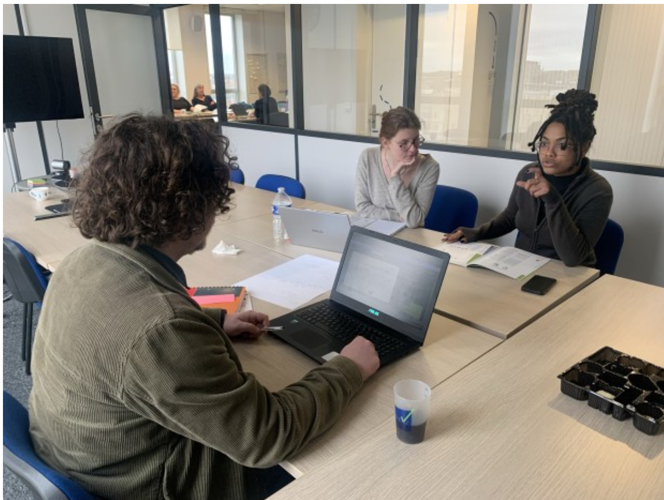
Session nationale dédiée aux CRPV

Aujourd'hui, cette démarche prend une nouvelle dimension, en s'adressant à des territoires partout en France grâce à nos homologues CRPV. Une opportunité pour multiplier les impacts positifs au service de l'intérêt général.