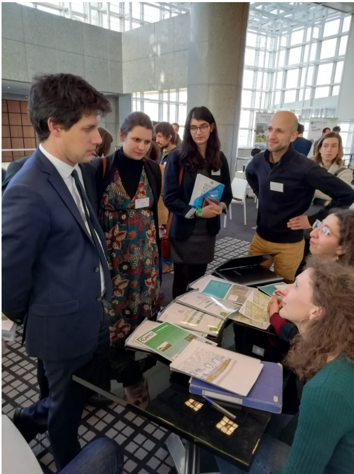
Le Ministre en charge de la Ville et du Logement, Julien Denormandie, à l'écoute des territoires NPNRU porteurs de projets d'agriculture urbaine soutenus au titre du PIA

Pour plus d'information, cliquez ici [7].