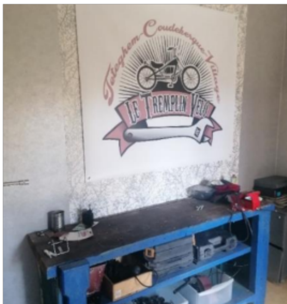
Local Tremplin vélo

Un atelier vélo porté par un centre social, animé par des jeunes bénévoles du quartier en pied d'immeuble : l'expérience concilie les mobilités durables, l'économie circulaire, le lien social et la gestion urbaine de proximité. Une initiative favorable dans un contexte de renouvellement urbain qui va transformer le quartier sur les prochaines années.