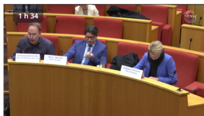
Dégâts des émeutes : témoignages de maires