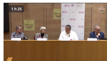
Émeutes de juin 2023 : l'avis des sociologues