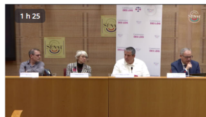
Émeutes de juin 2023 : l'avis des sociologues