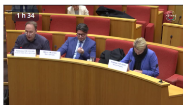
Dégâts des émeutes : témoignages de maires