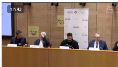
Émeutes : avis des sociologues et politistes

Le 16 janvier, la commission d'enquête du Sénat sur les « émeutes survenues à compter du 27 juin 2023 » entendait trois chercheurs spécialistes des relations police population.